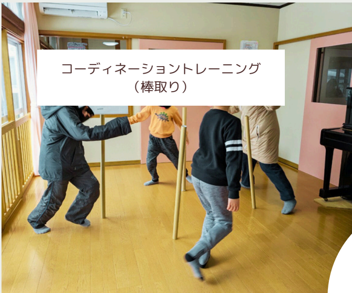
コーディネーショントレーニング （棒取り）