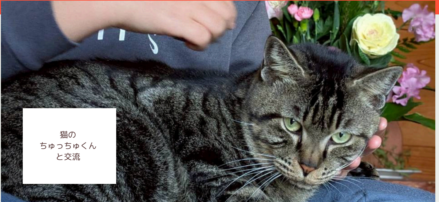
猫の ちゅっちゅくん と交流