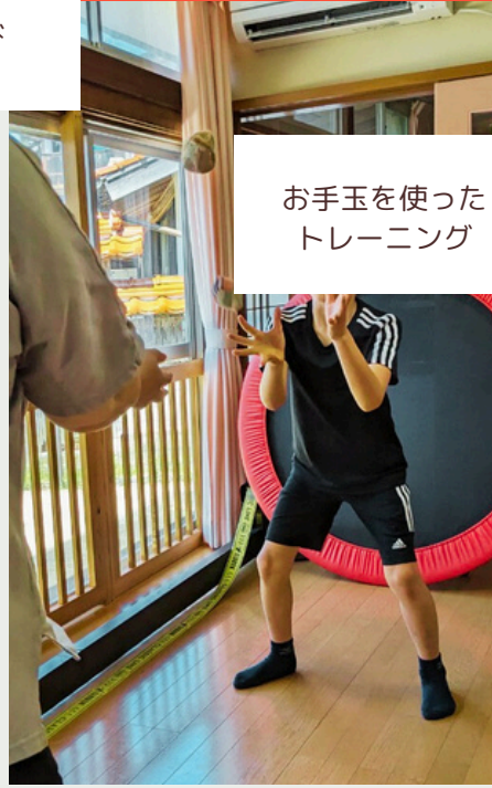
お手玉を使った トレーニング