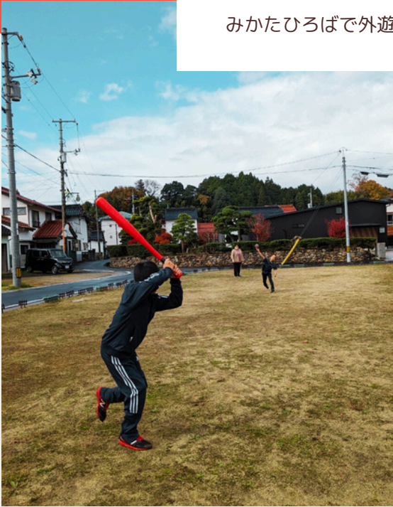
みかたひろばで外遊び